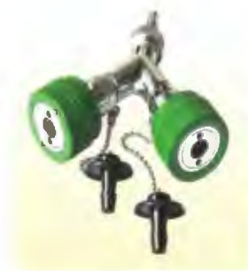
Twin outlet medical