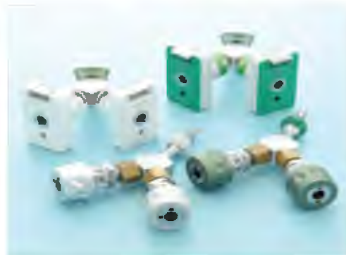
Conector twin outlet