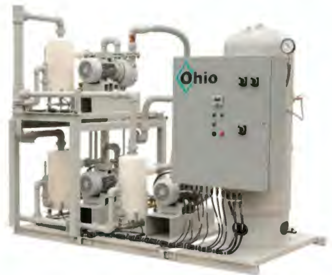
Medical Compress Air