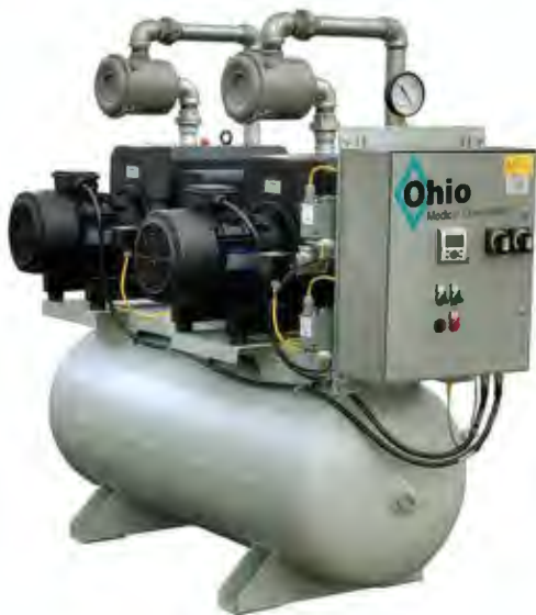
Medical Vacuum Pump