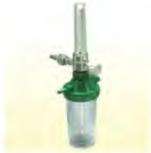
Flowmeter + humidifier