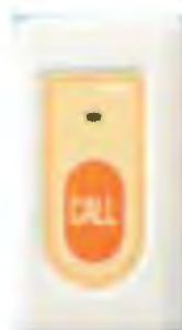
NIR 7 HW